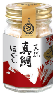
天然真鯛ほぐし（イメージ）