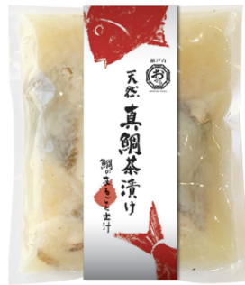
天然真鯛茶漬け 鯛まるごと出汁（イメージ）